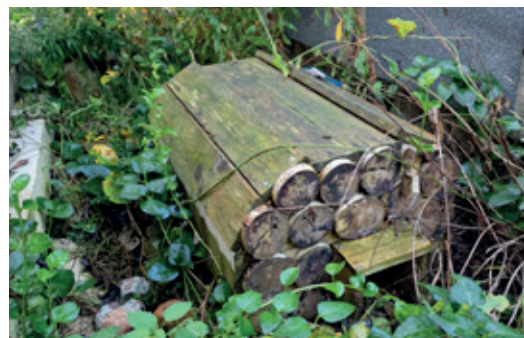
Abri à hérisson du jardin de La Maison Dahlia