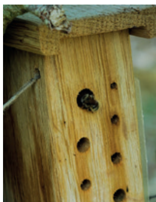
Hôtel à abeilles solitaires