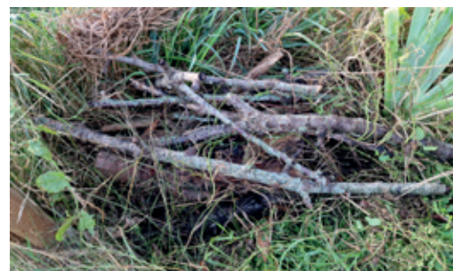
Tas de bois du jardin de La Maison Dahlia

... Pour les hérissons, les oiseaux et les pollinisateurs !