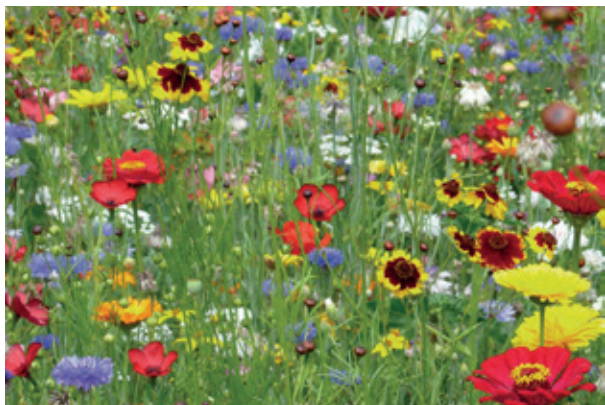
Zone non tondue avec des fleurs sauvages

Garder une petite zone non tondue dans son jardin permettra aux fleurs sauvages de pousser et attirera les papillons et autres pollinisateurs dans votre jardin.