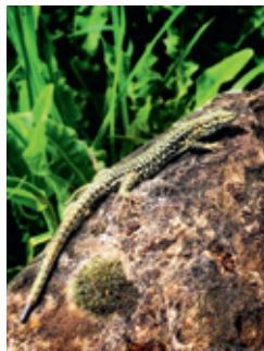
Lézard des murailles