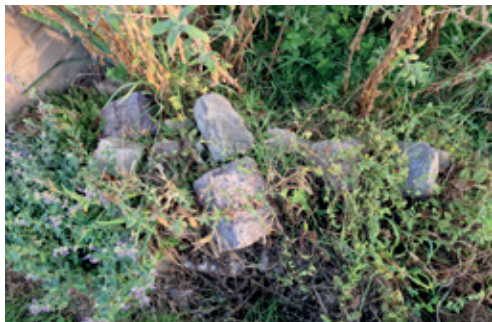
Rocaille du jardin de La Maison Dahlia