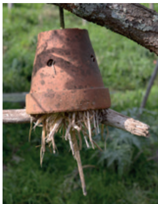
Gîte à perce-oreille