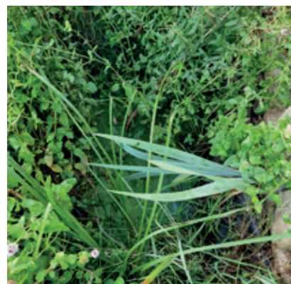
Bassin du jardin de La Maison Dahlia

Rendez-vous au jardin de La Maison Dahlia, au 70 avenue Paul Verlaine.