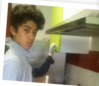
Un jeune homme aux fourneaux.