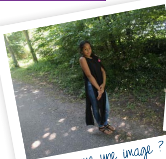
Sage comme une image ?