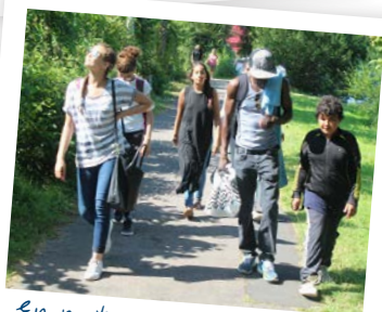
En route pour le lac de Caniel.

Parallèlement à cela, tout au long de l'année, des accueils pour la jeunesse sont prévus, les mardis et vendredis soirs, de 19 h à 21 h 30. Aliou accueille un groupe de douze jeunes, afin de développer des projets, pratiquer des activités de loisirs, culturelles, du sport... ■