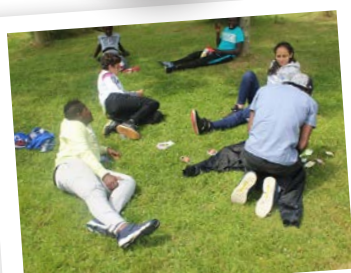
Elle est pas belle la vie ?

Quelques photos pour vous présenter le groupe accueilli à l'Espace Pierre Hamet cet été.