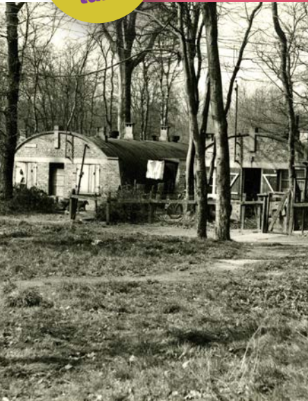
© Archives Municipales du Havre - 31F2563