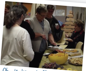
Oh, le beau buffet !!!