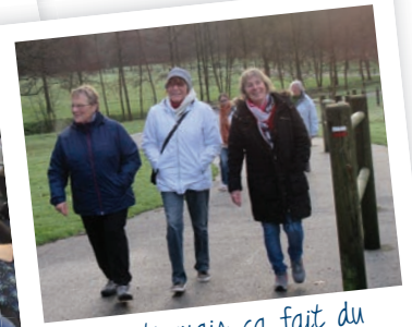
Ça monte mais ça fait du bien !!!