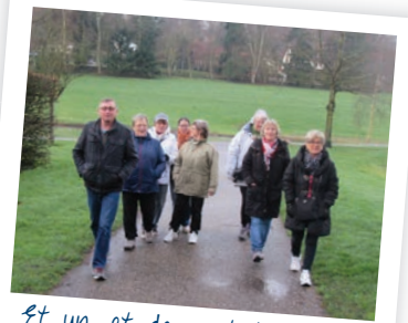
Et un, et deux...et trois kilomètres...