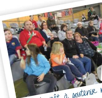
On est prêt à soutenir nos basketteurs...