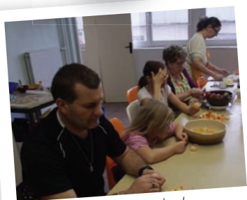
Attention de bien tout éplucher...

Une remise en jambes après les fêtes pour remettre le corps d'aplomb et pour bien commencer 2016. Visite en marche douce du parc de Rouelles ■