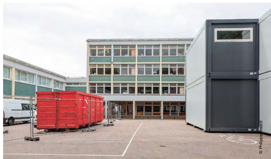
Les travaux de rénovation du groupe scolaire Jehan de Grouchy s'étendront jusqu'à l'été 2024.