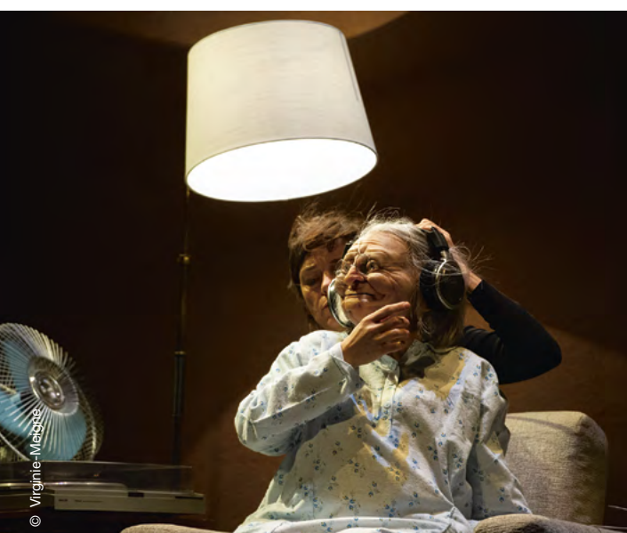
Dimanche , théâtre contemporain, les 20, 21 et 22 décembre dans la grande salle du Volcan

Billetterie 7 j/7, 24 h/24 sur billetterie.lehavre.fr ou à l'accueil du Théâtre de l'Hôtel de Ville du mardi au vendredi de 12 h 45 à 18 h 30, le mercredi de 9 h 30 à 11 h 30 et le samedi de 14 h à 18 h 02 35 19 45 74