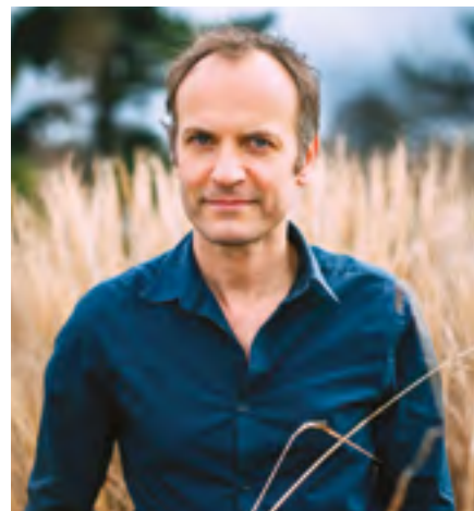
  Chlo  Volmer / Editions Gallimard

Vendredi 29 septembre   18 h Timoth e de Fombelle L'auteur jeunesse pr sentera et d dicacera son troisi me tome d' Alma , dernier volet  blouissant d'un r cit d'aventure sur l'esclavage et le combat de l'abolition. La Galerne Entr e libre, dans la limite des places disponibles