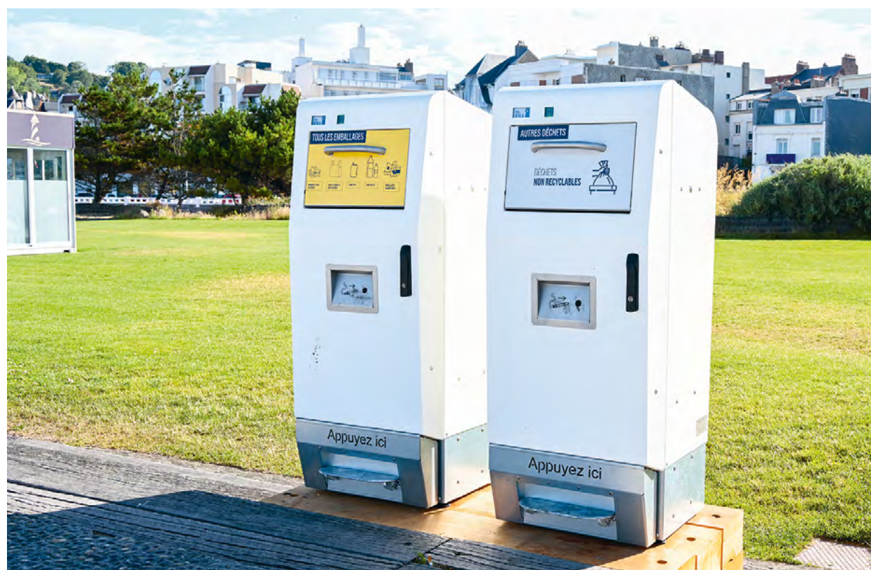
Poubelles compactantes expérimentées à la plage. D'ici trois ans, plus de 350 poubelles compactantes seront installées dans la ville.