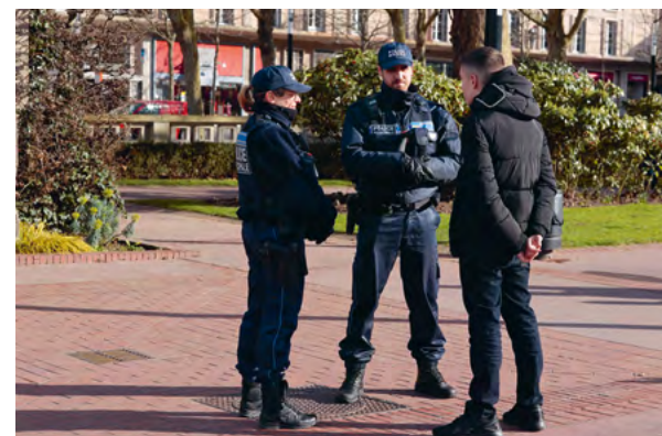
La police municipale, mobilisée contre les incivilités

En matière d'organisation, l'ouverture en septembre du nouveau centre technique Louis Blanc en ville haute, ainsi que le recrutement et la formation