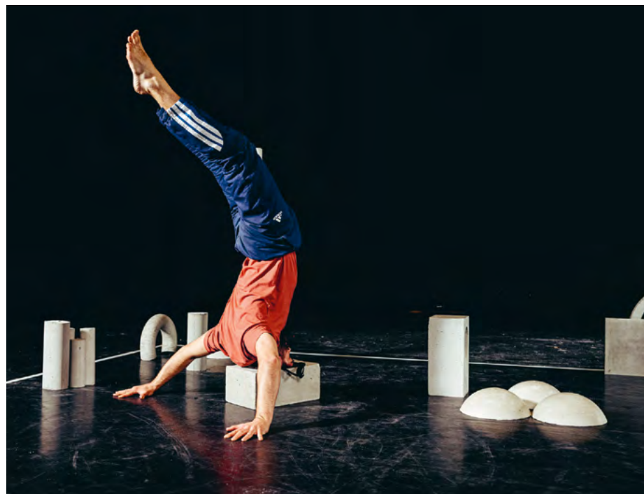
Korrol, le mercredi 10 avril au Volcan