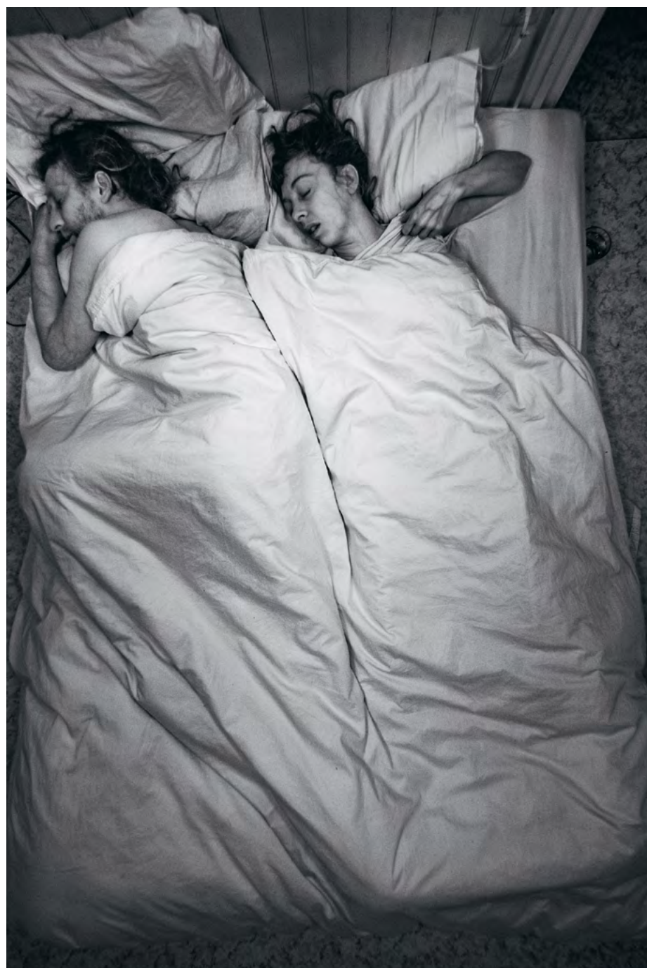
Radioscopie du dormeur

Informations et lieux d'exposition sur areyou-experiencing.fr