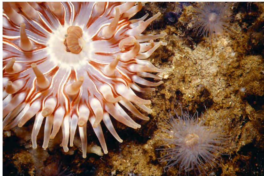
Les petites bêtes et grands bassins, le mercredi 29 mai au Port Center