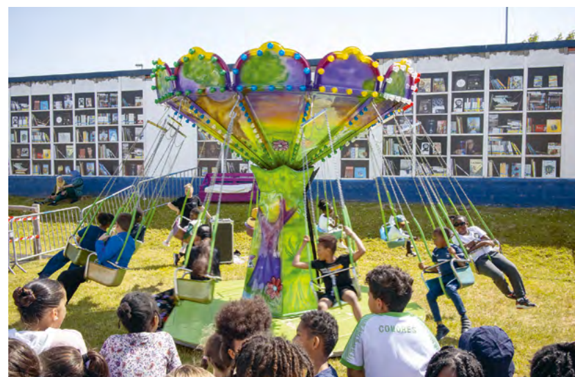
Un manège de chaises volantes à Bléville