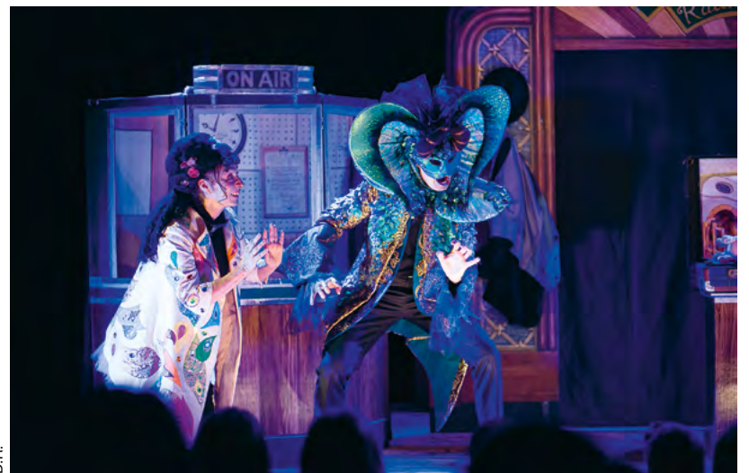
La Belle et la Bête, comédie musicale, adaptée et scénarisée par la Compagnie OZ

Depuis 35 ans, les élèves de CM2 et de sixième assistent chaque année à un spectacle musical professionnel entièrement en anglais. Les 30 et 31 mai, deux contes seront à l'affiche du Petit Théâtre.