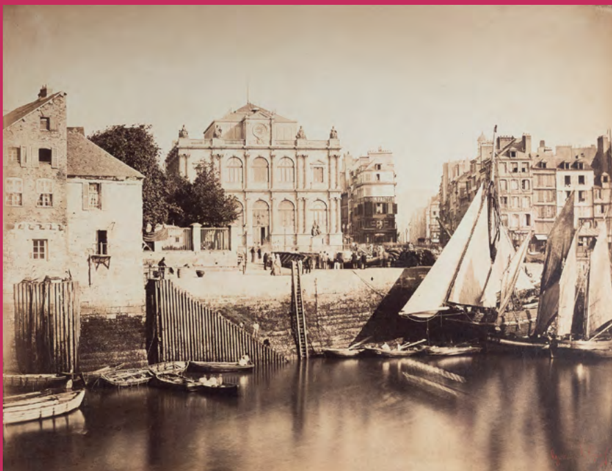
Gustave Le Gray, Musée-bibliothèque et ville du Havre , 1856, tirage sur papier albuminé d'après négatif sur verre au collodion, 32 x 42 cm, Le Havre, Bibliothèque municipale