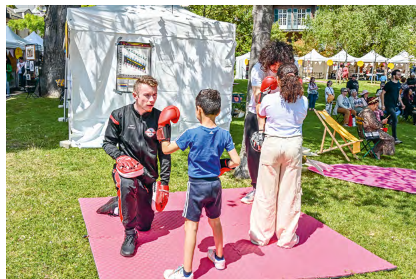
Démonstration sportive à Sanvic