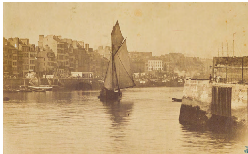
Onésippe Aguado, Vue du port du Havre avec vue de l'hôtel de l'Amirauté , 1863, tirage sur papier albuminé d'après négatif sur verre au collodion, 25 x 40,4 cm, Paris, coll. SFP

La période couverte par l'exposition s'étend des premières années où furent divulguées les techniques photographiques, jusqu'à l'aube d'une ère nouvelle, celle du cinéma et de la démocratisation de la photographie, via notamment les photos-clubs.