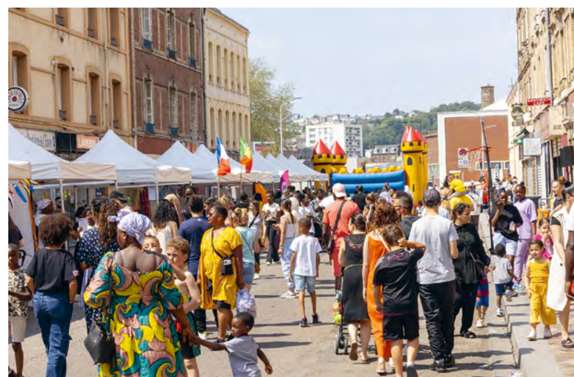
Un bel espace ouvert à tous rue Gustave-Brindeau