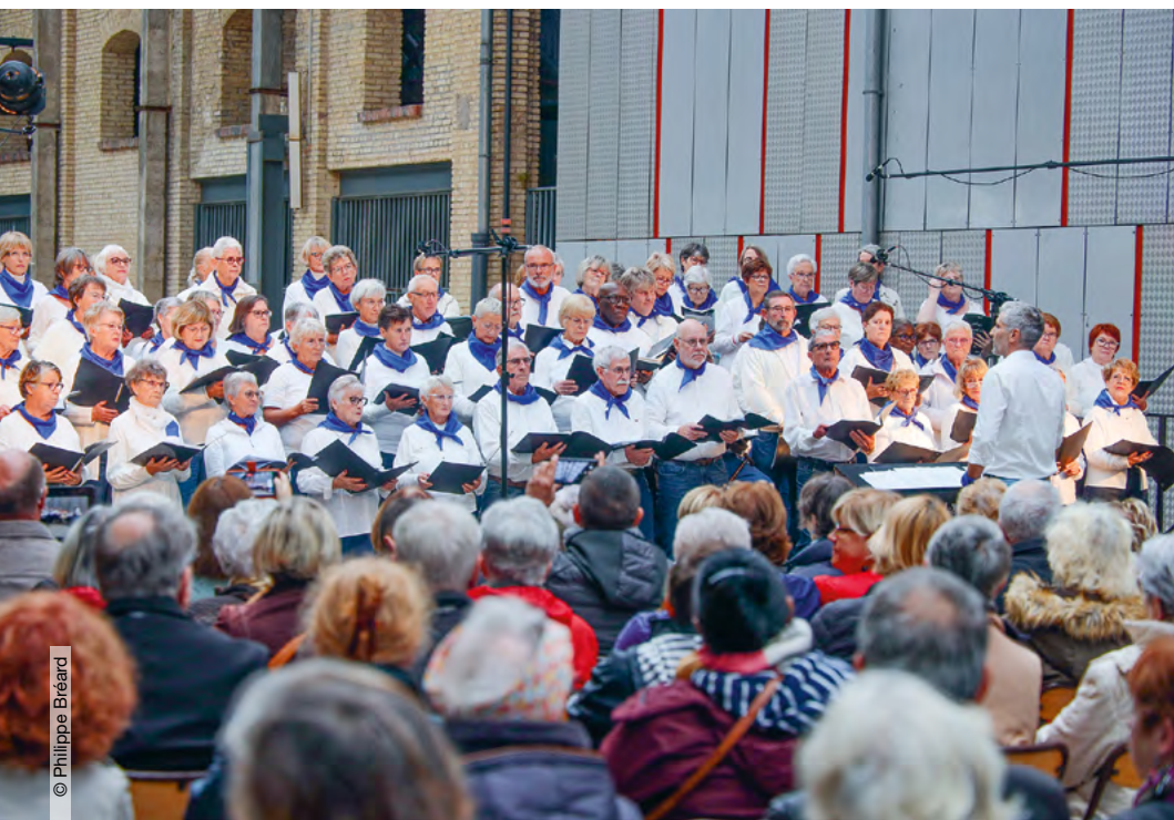
La chorale Escapade du CCAS et l'ensemble musical Fugato du Conservatoire vous proposent un concert composé de musiques et de chansons.

Pour la deuxième année, la Ville du Havre a créé une programmation en faveur des plus isolés via une semaine de rencontres et de rendez-vous contre l'isolement des personnes âgées.