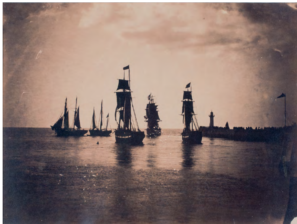
Gustave Le Gray, Bateaux quittant le port du Havre , 1856, tirage sur papier albuminé d'après négatif sur verre au collodion, 32,5 x 42,5 cm, Quimper, Archives départementales du Finistère, en dépôt au MuMa

Du 25 mai au 22 septembre, le MuMa propose une incursion inédite dans le dialogue entre les œuvres impressionnistes et les premières photographies, de 1840 à 1890. « Photographie en Normandie » nous en dit aussi beaucoup sur le rôle des Havrais, pionniers de cet art.