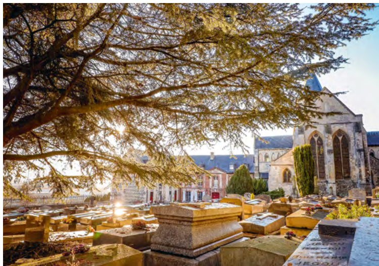
Cimetière de Gravelle

Marché de Saint-François : quai de l'Île, tous les vendredis de 16 h 30 à 19 h