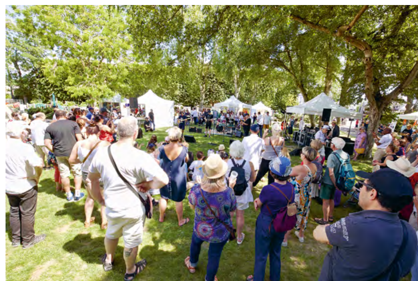
Concert en plein air à Sanvic

Plus d'informations dans vos Fabriques ou sur lehavre.fr Gratuit et ouvert à tous