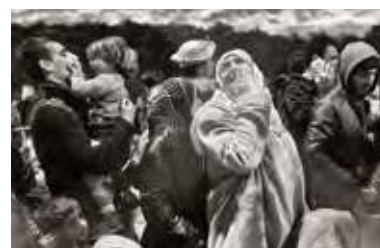
Hotspot de Moria, Lesbos, Grèce, décembre 2015.